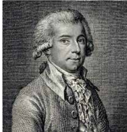
Vicente Martín y Soler en un grabado de Jacob Adam, Viena 1787

El ambiente cultural vienés es de una riqueza apabullante, y cuando José II reina, multitud de artistas acuden en busca de una oportunidad. Y entre ellos, un compositor valenciano, Vicente Martín y Soler (1754-1806).