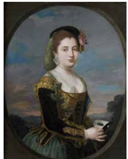
Copia retrato Marquesa del Llano. Autor desconocido. Colección particular

Entonces, si el Marqués del Llano se refiere al traje de su esposa como de maja sin que exista referencia alguna a que se trate de un atavío manchego, y siendo evidente que el vestido contiene todos los elementos del estilo majo, ¿dónde se encuentra la razón para que algunos autores lo califiquen como un modo de vestir a la manchega?