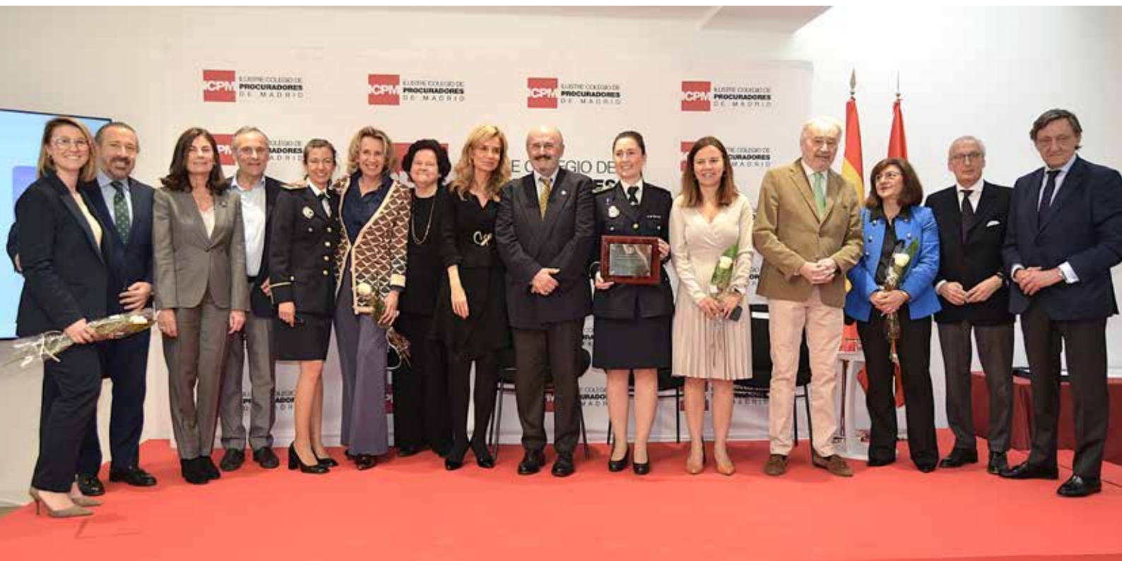
Foto de grupo con las autoridades presentes en el acto.