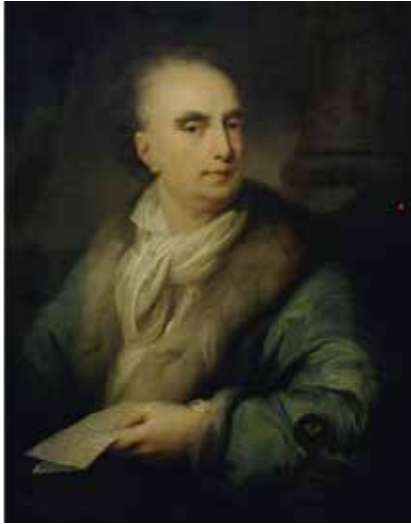
Marqués de Llano por Matías Grassi (1790)

cuchaba tocar a los músicos que visitaban el estudio; contaba además con un nutrido grupo de alumnos, facilitándoles incluso la manutención y alojamiento a los que carecían de medios económicos.