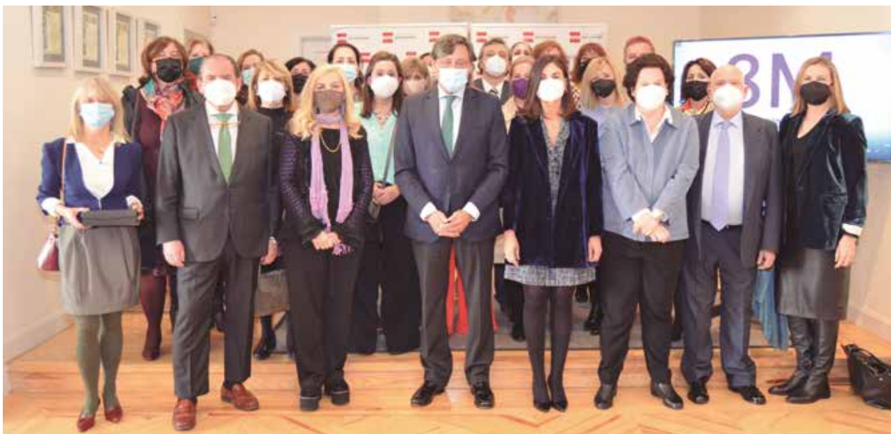
Foto final de familia con asistentes al acto.